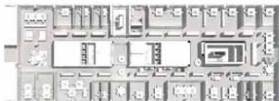
FOTO ONDER Tekeningen.

Op de twaalfde verdieping is een grote ruimte voor studenten. Onder de collegezalen zijn zitjes gemaakt.