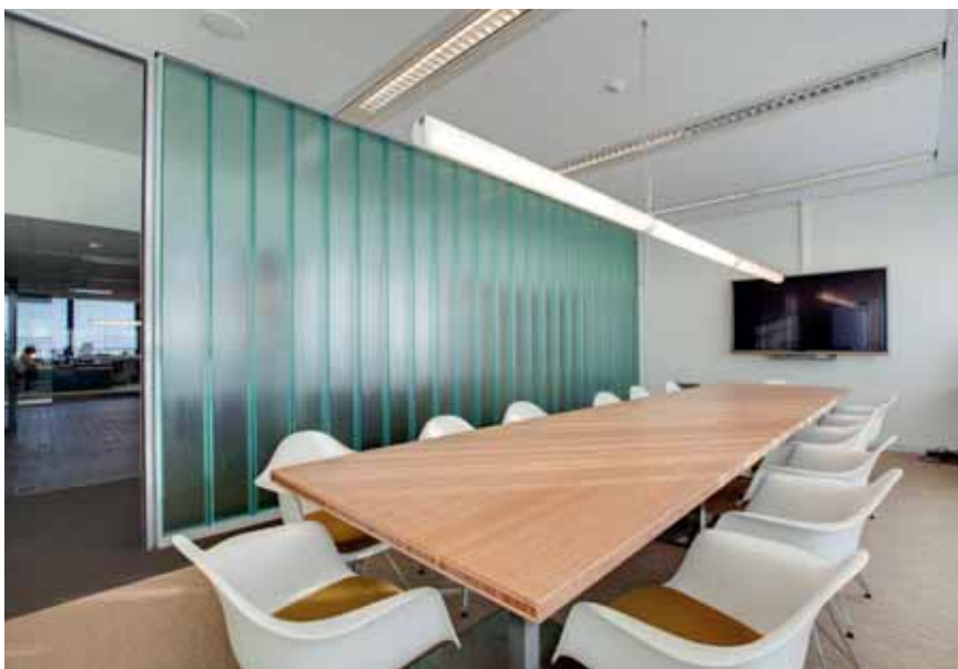
FOTO BOVEN Een vergaderruimte kreeg een chique uitstraling met stoelen van Vitra en een buislamp van Etap.